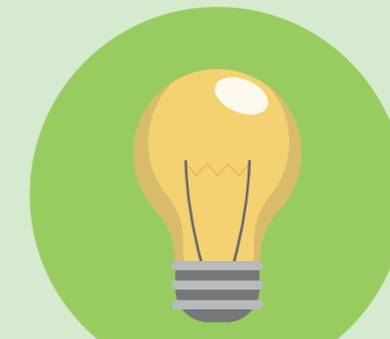
新商品・サービス企画

東京デザインデータベースに登録している幅広いジャンルのデザイナーの中から案件に最適な方を探すことができます！