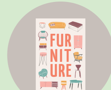
パンフ・カタログ